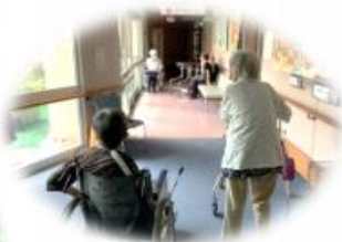
昼食後のゆったり時間