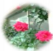
季節ごとに様々な花が咲きます 🌸

以前から、苑内の散歩の声掛けをしておりますが、無理のない範囲を基本に、楽しみながら歩いていただけるような工夫を検討します。例えば「綺麗な花が咲いている中庭を見ながら散歩しませんか？」のような、利用者様の興味を引くようなネタを考えていきます。